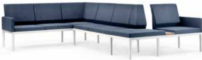
Reform niedrige Rücken

Reform Sofasystem bietet endlose Kombinationsmöglichkeiten an. Es gibt verschiedene Rückenhöhen, Sitzhöhen, 42, 46 und 65cm, verschiedene Armlehne/Trennwände und eine Vielzahl von Modulen.