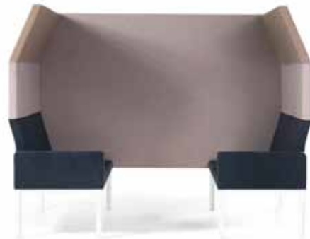
Reform, höchste rück höhe, trenn Wand 212cm, Armlehnen