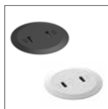
Powerdot Mini USB 2 USB-C PD (30W/20V/1,5A) Schwarz / Weiß