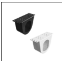
Powerdot Halterung Mini, einzel Schwarz / Weiß