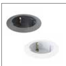
Powerdot Mini Electric 1 Strom (Typ F, Schuko) Schwarz / Weiß