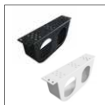
Powerdot Halterung Mini, doppelt Schwarz / Weiß