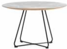
Speed Table 47