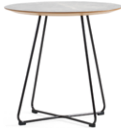
Speed Table 57