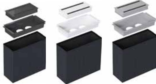
Powerdot package 31x15 Tischabdeckung und Ablage in Schwarz, Weiß oder Silber

Powerdot package, 2 Powerdot Electric (2 Strom)